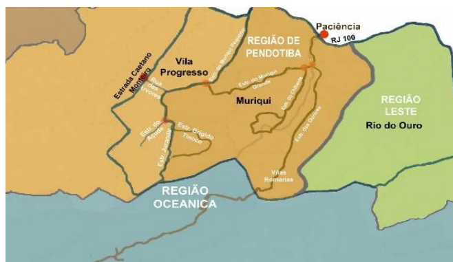
Proposta para a reintegração do bairro do Muriqui à Região de Pendotiba.

As localidades do Ourives e Vilas Romanas são partes integrantes de um só território, o Muriqui; compartilham a mesma ambiência e o único acesso com o Muriqui Grande e Chibante. Neste território, assim compreendido por seus moradores, se faz presente o sentimento de vizinhança e pertencimento, além da contínua luta por soluções e melhorias institucionais e em infraestrutura.