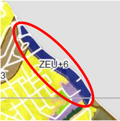
Trecho do Mapa 1 a ser modificado na Estrada Velha de Maricá (ou Avenida Abdias José dos Santos)

Art. 1º. Fica modificado no Mapa 1 os parâmetros urbanísticos ZEU+6 e ZUM+6 ZCL+6 do Projeto de Lei nº 221/2023, vicinais à Estrada Velha de Maricá (ou Avenida Abdias José dos Santos), também no trecho conhecido como Estrada da Paciência, à Rodovia RJ-106 e à Av. Plínio Gomes de Mattos Filho (na entrada de Várzea das Moças) quanto ao gabarito, reduzindo-os para 1 (um) pavimento e 1 (um) de embasamento, sem cobertura, devendo de forma correspondente, alterar o Quadro III.a Gabarito.