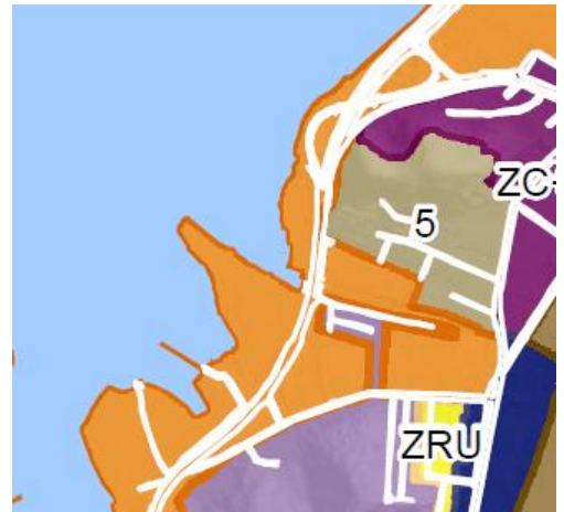
Mapa 1 a ser modificado