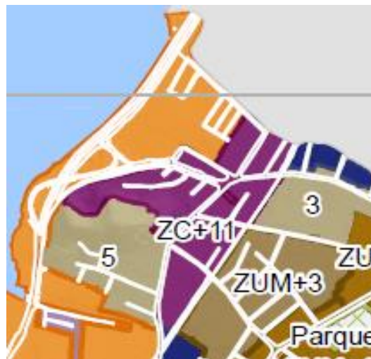
Mapa PL 221/2023