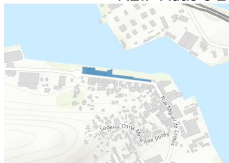
AEIP Ponta D'Areia