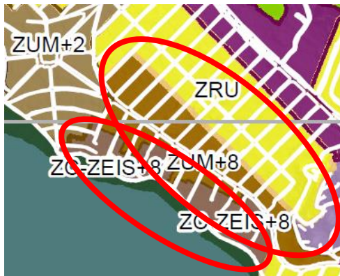
Trecho assinalado do Mapa 1

Parágrafo único. O Mapa 1 é adicionalmente para restabelecer o parâmetro ZEIS, na quadra mais próxima da Lagoa, conforme definido no Mapa 8 do Plano Diretor.