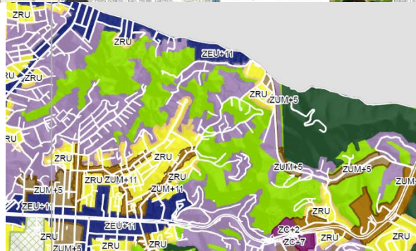
Mapas Plano Diretor